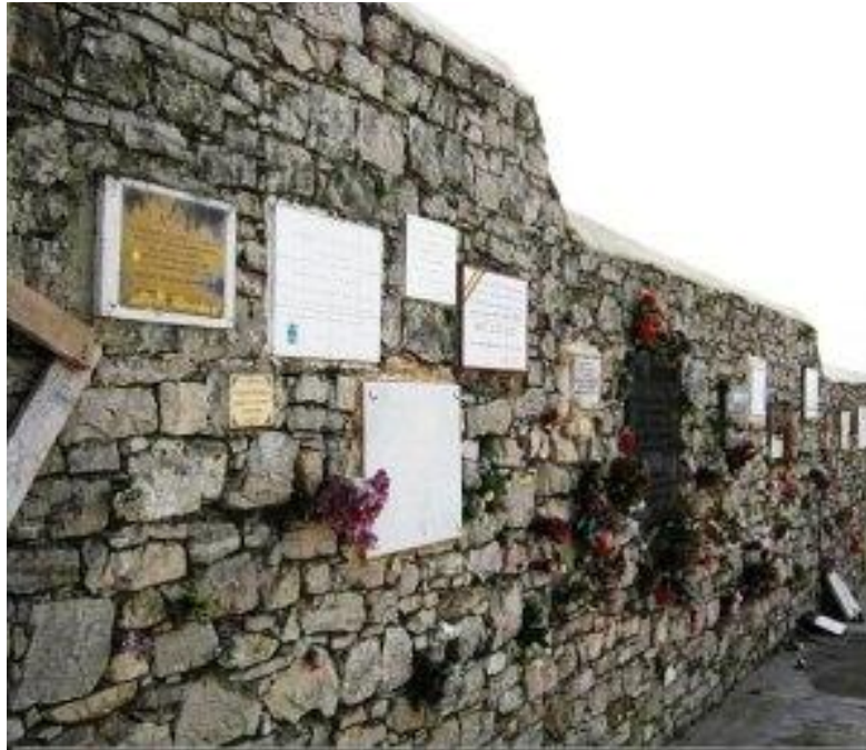
Paredón donde fueron fusilados masones Gijón. Cementerio de El Suco.

Se publica una Resolución 29 de la Presidencia del Gobierno por la que la Delegación de Asuntos Especiales con su Sección Masónica y la Delegación del Estado para la Recuperación de Documentos, dependientes la primera de Secretaría General del Jefe del Estado, y la segunda del Ministerio del Interior se refunden en una única oficina que se denominará DELEGACION NACIONAL DE SERVICIOS DOCUMENTALES (DNSD), dándosele a este nuevo organismo rango de Dirección General dependiente directamente de la PRESIDENCIA DEL GOBIERNO, con lo que se unifican los archivos policiales así como la custodia de los documentos y objetos requisados a la Masonería. Esta unificación representa una mejora operativa de los elementos represivos de mano de los servicios policiales y tribunales especiales, cuya impunidad y celo en las actuaciones venían reforzadas de una persistente propaganda antimasónica que impregnaba el sentir general. Ejemplo lo es el artículo publicado el año antes en La Vanguardia del 15 de noviembre de 1943 30 con el título: