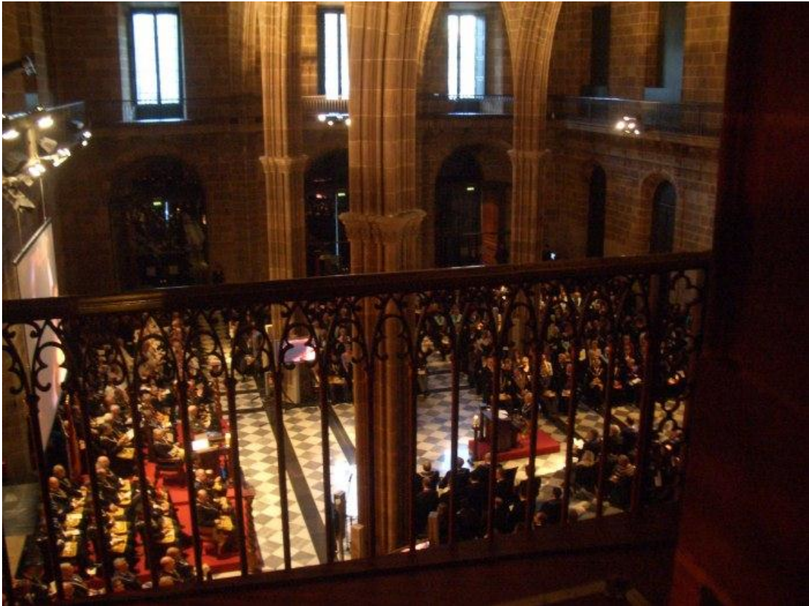
Imagen de una ceremonia de la Gran Logia de España en Barcelona conmemorando sus 25 años de legalización

La Audiencia Nacional ordenaba que se inscribiesen, y por lo tanto legalizaba, las asociaciones masónicas, y ello en contra de la postura del Ministerio del Interior de España, que aun continuaba negándose. Los magistrados autores de la sentencia fueron ilustres juristas, ya que un de ellos fue después ministro de Justicia y otro magistrado del Tribunal Constitucional. Al amparo de esta sentencia, la Masonería española pudo volver a existir y empezar a reconstruir su organización, prevaleciendo entonces entre los masones la tesis de restablecerla bajo les normas internacionales de la Masonería regular que, a diferencia de la irregular de origen francés, es la mayoritaria en el mundo.